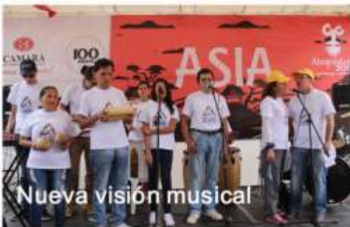
Nueva visión musical