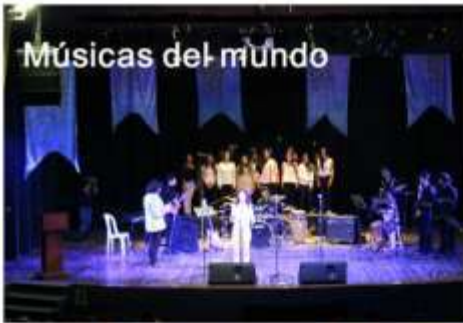
Músicas del mundo