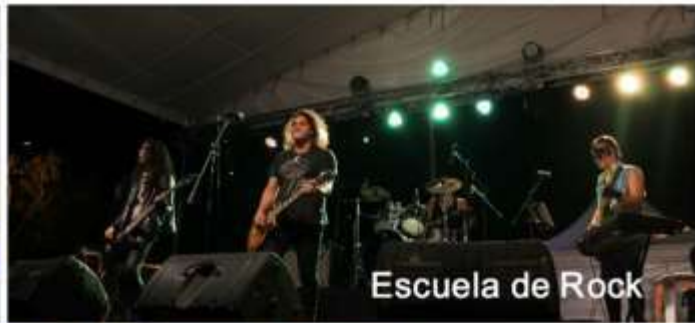
Escuela de Rock