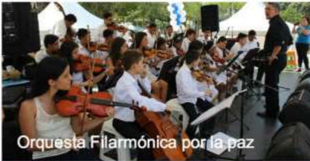
Orquesta Filarmónica por la paz